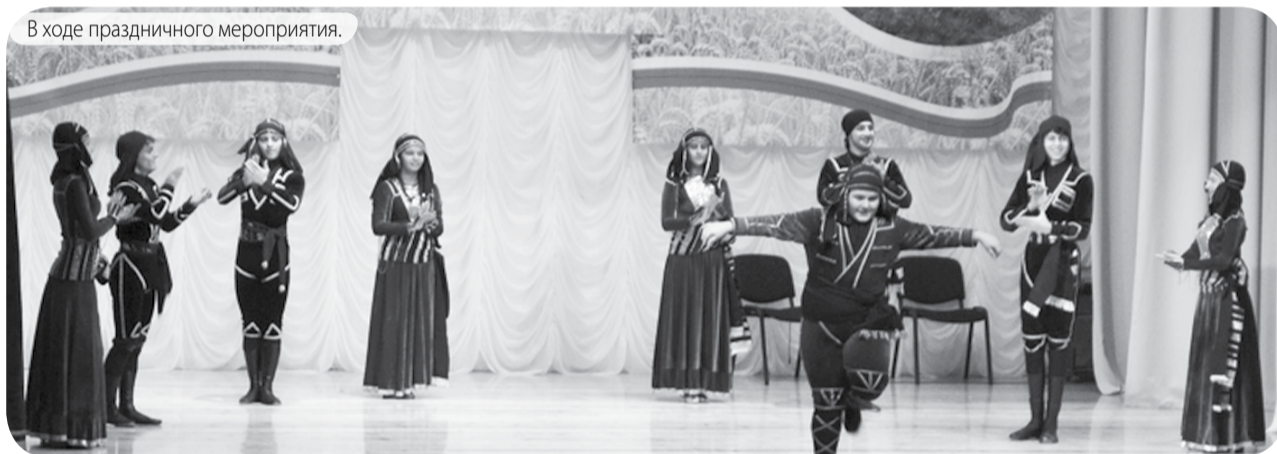
В ходе праздничного мероприятия.